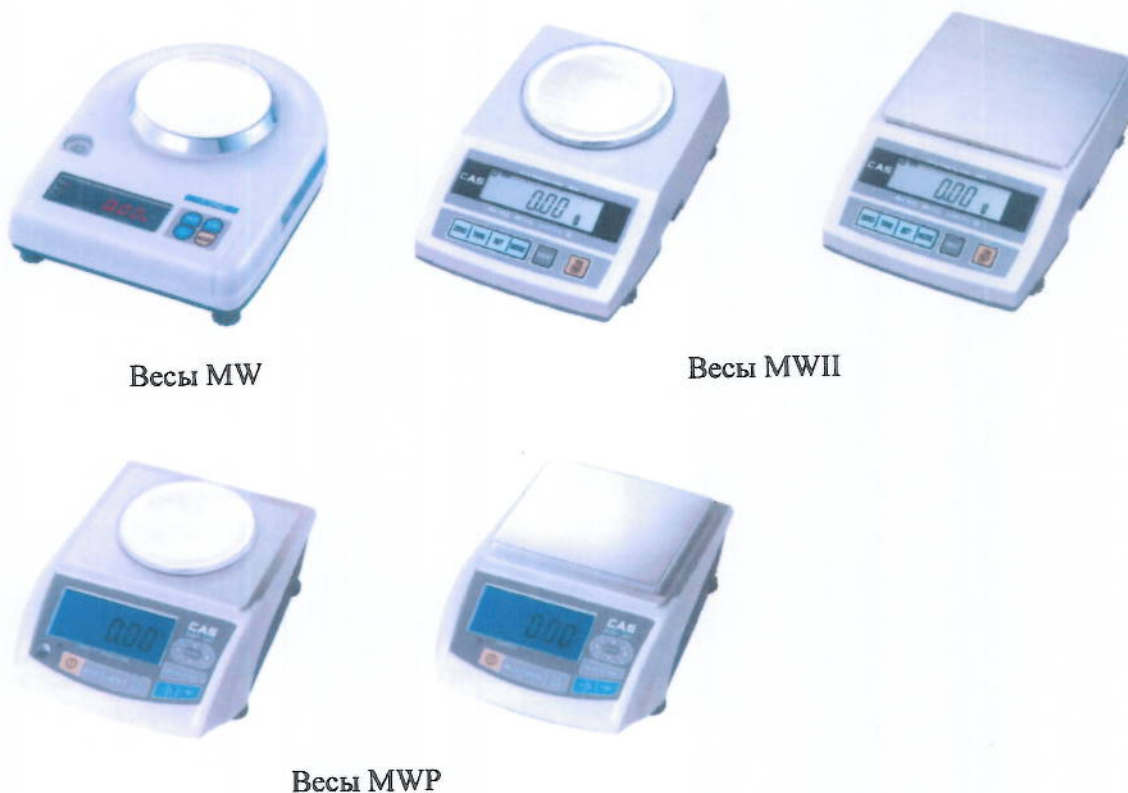
Рисунок 1 – Общий вид весов MW, MWII, MWP

Общий вид весов представлен на рисунке 1.