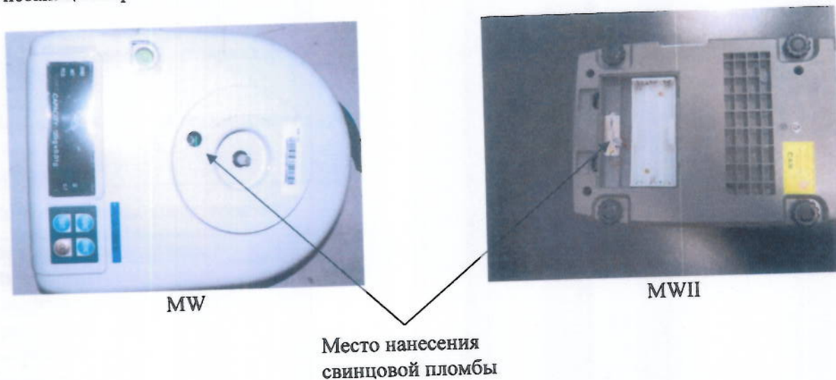
Рисунок 2 – Место пломбировки весов

Знак поверки в виде наклейки наносится на лицевую панель весов. Схема пломбировки от несанкционированного доступа приведена на рисунке 2.