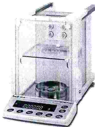
Рисунок 1 – Общий вид весов

Общий вид весов представлен на рисунке 1.